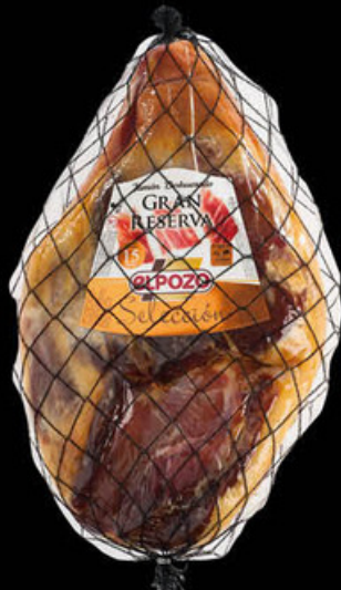
10792 Jamón GRAN RESERVA Deshuesado N/U • UDS./CAJA 1