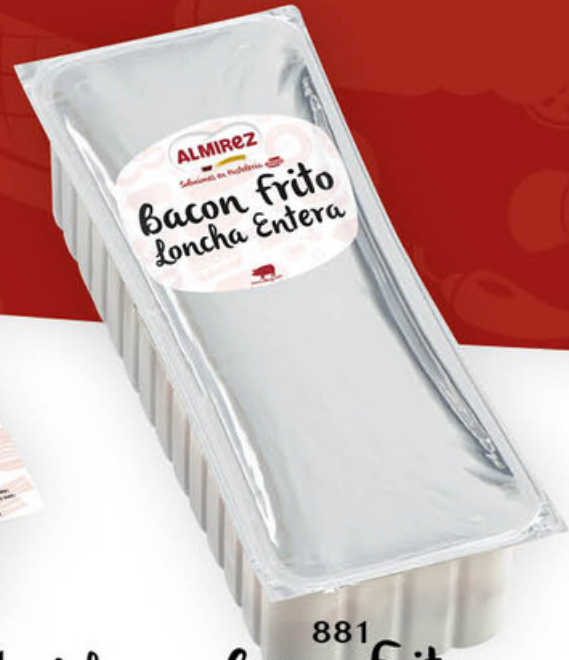
881 Bacon Frito Loncha Entera 84108430 08811 • 1,25kg Uds./Caja 4