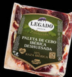
3912 Paleta Cebo Ibérica Moldeada N/U • UDS./CAJA 1