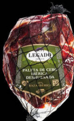
127 Paleta Cebo Ibérica Deshuesada N/U • UDS./CAJA 1