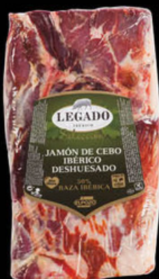
1766 Jamón Cebo Ibérico Moldeado N/U • UDS./CAJA 1