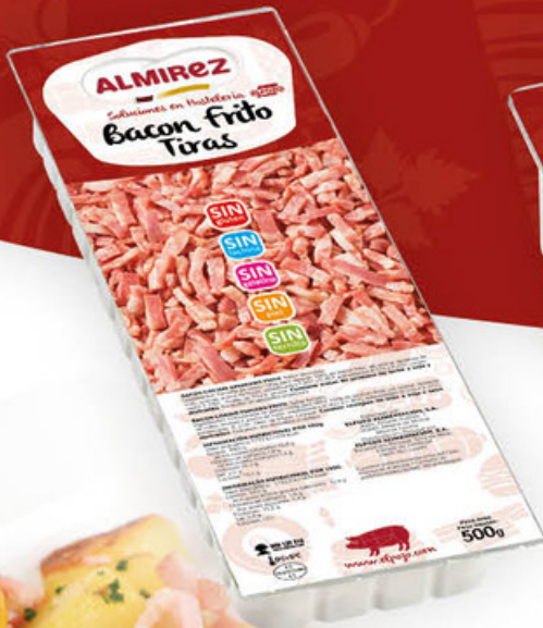
5085 Bacon Frito Tiras 84108430 50858 • 500g Uds./Caja 8