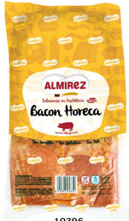
10396 Bacon Horeca 84108431 03967 • N/U Uds./Caja 3