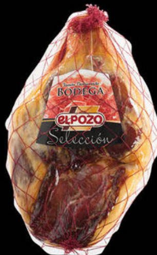
3005 Jamón BODEGA Deshuesado N/U • UDS./CAJA 2