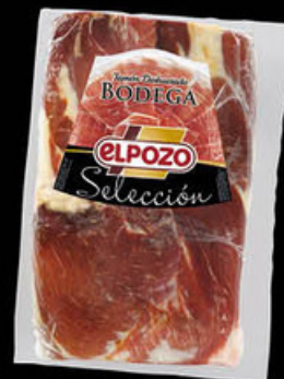
3006 Jamón BODEGA Moldeado N/U • UDS./CAJA 2