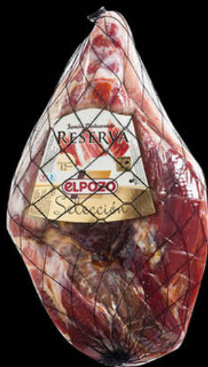
12045 Jamón RESERVA SERIE ORO Desh. Pulido N/U • UDS./CAJA 1