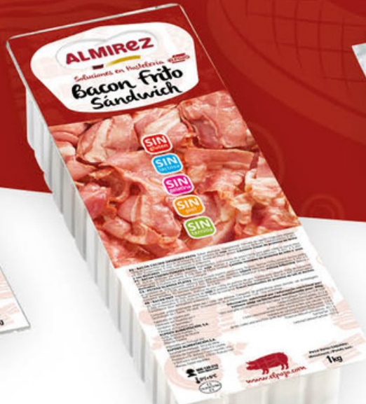
5086 Bacon Frito Sándwich 84108430 50865 • 1kg Uds./Caja 4