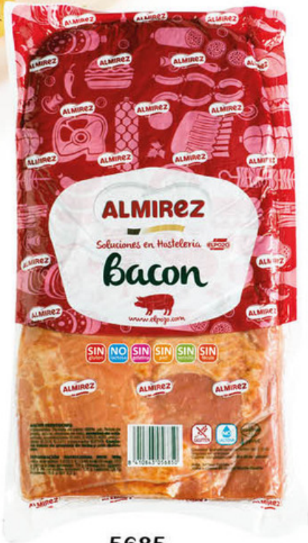
5685 Bacon 84108430 56850 • N/U Uds./Caja 2