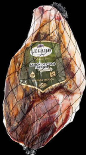
0113 Jamón Cebo Ibérico Deshuesado N/U • UDS./CAJA 1