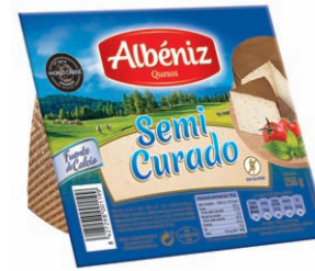
Queso semi curado Sliced semisoft blended cheese Halbreifer Mischkäse in Scheiben