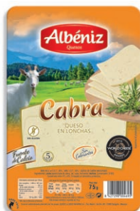
Queso de cabra Goat Cheese Ziegenkäse