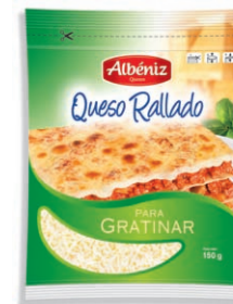
Queso rallado para gratinar Grated Cheese au gratin Geriebener Käse zu gratinieren