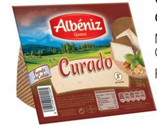
Queso curado Matured Blended Cheese Reifer Mishkäse