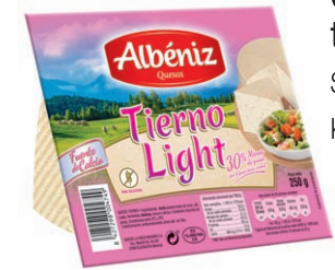
Queso tierno light Soft cheese light Käse Light