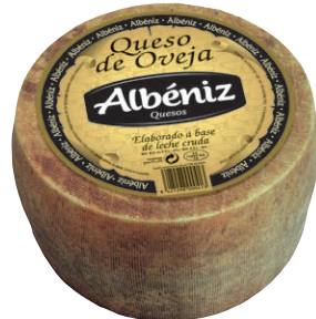
Queso de oveja Sheep Cheese Schafskäse