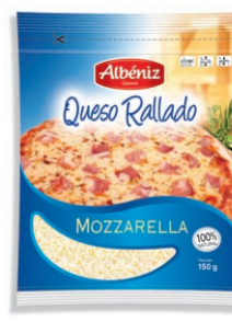
Queso rallado mozzarella Mozarella grated Cheese Geriebener Mozzarella Käse