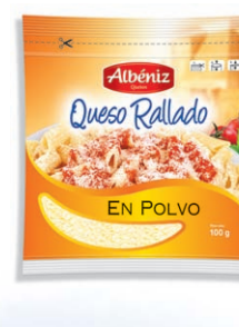
Queso rallado en polvo Powder Cheese Geriebener Käse in Pulver