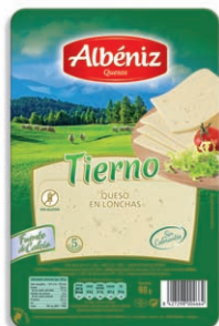
Queso tierno Soft Blended Cheese Weicher Mishkäse