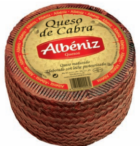
Queso de cabra Goat Cheese Ziegenkäse