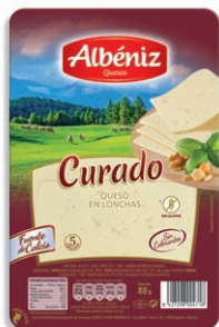
Queso curado Matured Blended Cheese Reifer Mishkäse