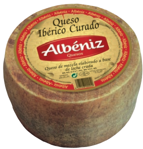
Queso Ibérico curado Matured Iberico Cheese Reifer Iberico Käse