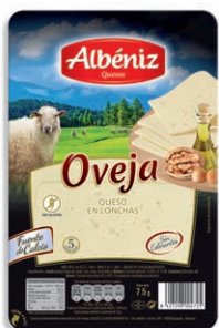
Queso oveja Sheep Cheese Schafskäse