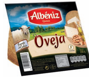
Queso de oveja Sheep Cheese Schafskäse