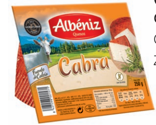
Queso de cabra Goat Cheese Ziegenkäse