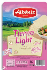
Queso tierno light Soft cheese light Käse Light