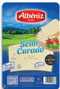
Queso semicurado Sliced semisoft blended cheese Halbreifer Mischkäse in Scheiben