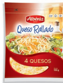
Queso rallado 4 quesos Grated Cheese 4 cheeses Geriebener Käse 4 Käsesorte