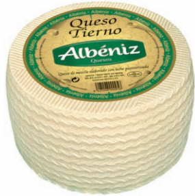
Queso tierno Soft Blended Cheese Weicher Mishkäse