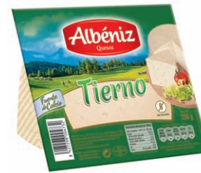
Queso tierno Soft Blended Cheese Weicher Mishkäse