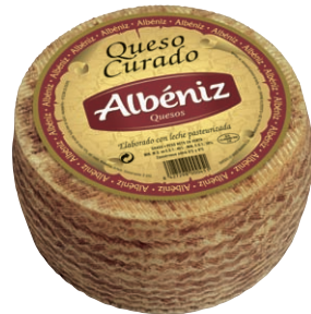
Queso curado Matured Blended Cheese Reifer Mishkäse