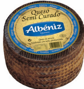
Queso semicurado Semi soft Blended Cheese Halbreifer Mishkäse